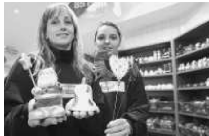
Le commesse del nuovo negozio a prezzi stracciati (Bertolin)

Ma la gente, questa entità sulla quale è facile scaricare ogni scomoda responsabilità, riempie anche le librerie, e i teatri, e le letture collettive di poesia, e gli incontri di filosofia. A questa gente cosa re-