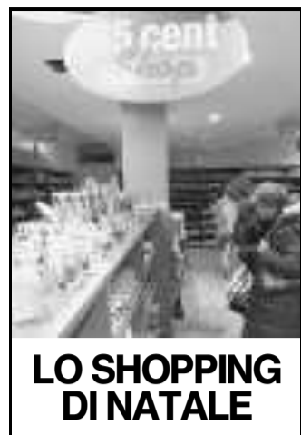
LO SHOPPING DI NATALE

L'indagine della Confesercenti: «Le feste saranno più spartane. C'è preoccupazione e si spende con oculatezza»